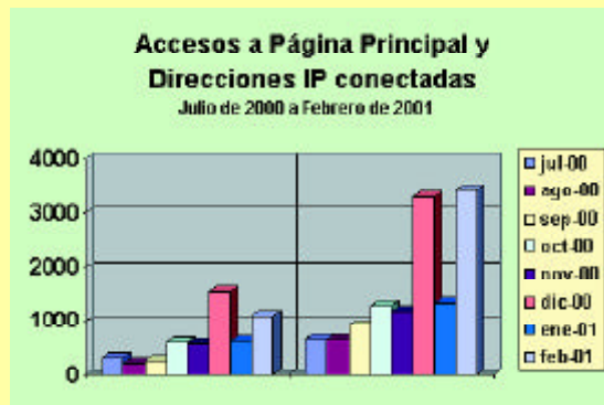
Figura 3. Accesos a la Página Principal (izquierda) y direcciones IP (derecha) conectadas al servidor Web.

Todo esto puede hacerse tal y como se ha estado haciendo desde su nacimiento, es decir poco a poco y a base de mucho esfuerzo, o bien podemos dar un salto cuantitativo a través de la colaboración de uno o más becarios –cuya contratación sólo es posible mediante el apoyo del sector empresarial– que permita hacer de esta Red Temática sin fines de lucro –eso es importante recalcarlo–, el sitio por excelencia y referencia de contenidos de calidad en materia de seguridad informática en toda Iberoamérica. n