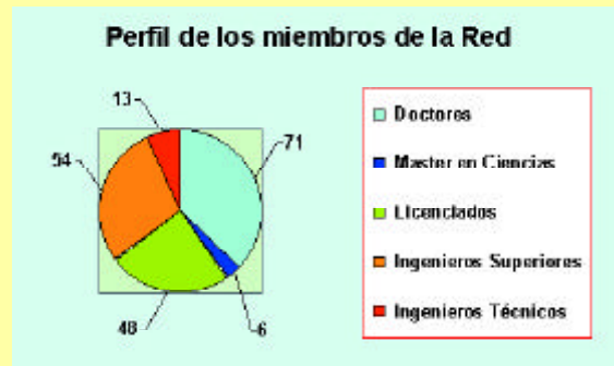
Figura 2. Perfil de los miembros.

Todos los miembros personales tienen una ficha con sus datos y direcciones profesionales –no personales– de universidad, centro o empresa, su fotografía y un resumen de sus áreas de investigación y/o desarrollo, con el objeto de poder en su momento incluir un buscador temático que permita encontrar al o a los profesionales más identificados con un perfil en particular. Este tipo de información y cualquier otra que signifique la actuación de un buscador y consultas dentro de la red en este sentido, no así para sus contenidos docentes