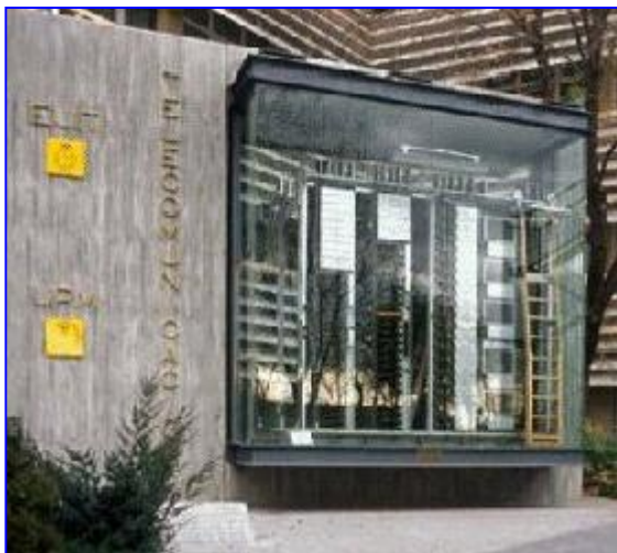
Escuela Universitaria de Ing. Técnica Telecomunicación