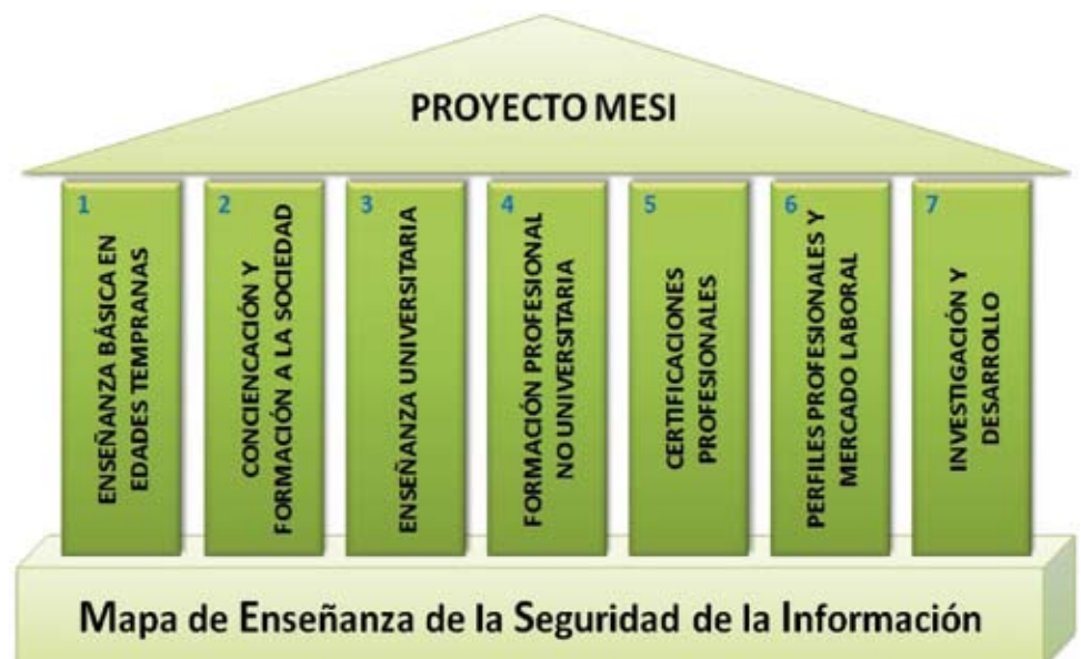
Figura 1.- Las siete columnas del proyecto MESI.

Aunque ya hemos sido testigos de un primer boom de estas enseñanzas en las universidades españolas hacia finales de la década de los años noventa, lo que dio origen a un primer informe sobre perfiles de asignaturas de seguridad publicado en esta revista [3], con la llegada del Espacio Europeo de Educación Superior (EEES) o Plan Bolonia, se ha producido un hecho sin precedentes que ha propiciado en poco menos de cinco años un profundo cambio en este tipo de formación universitaria. Atrás queda una situación anómala que venía produciéndose durante más de una década en los centros de educación superior, que relegaban a un segundo plano las enseñanzas de seguridad en las carreras